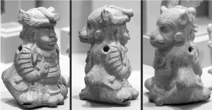
FIGURA 1.—Transformación de un personaje humano en su alter ego o uay . Personaje sedente con vestimenta completa en forma de bandas que se transforma en un uay o alter ego, posiblemente una zarigüeya. Silbato de cerámica estilo Jaina, Clásico Tardío, Museo de Arte, Universidad de Princeton.