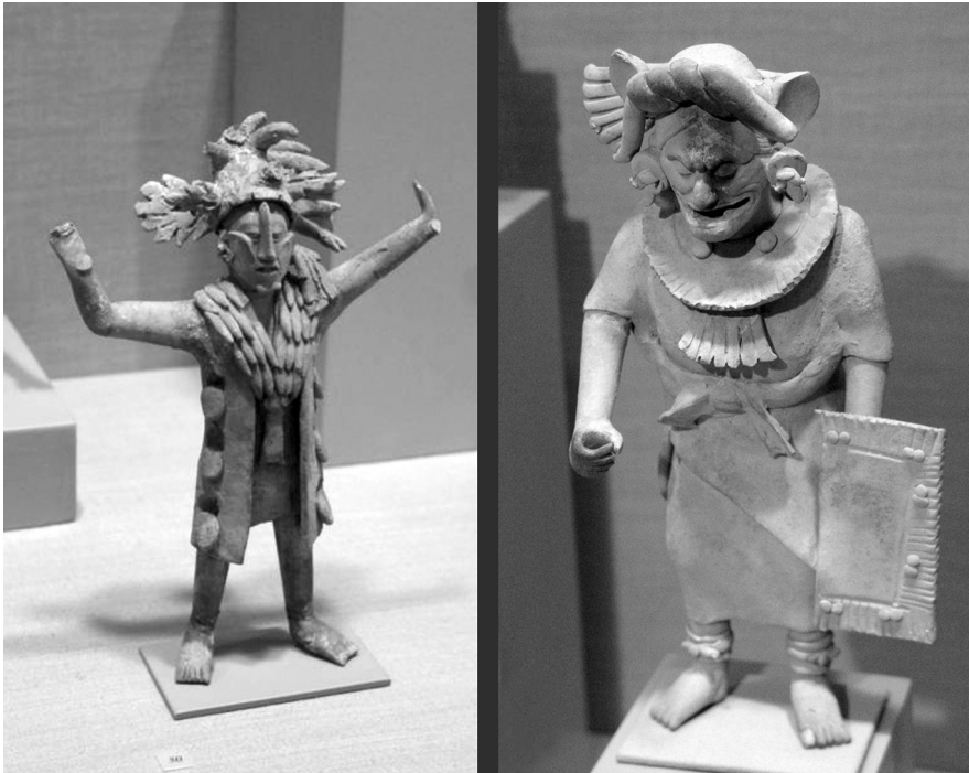
FIGURA 3.—Personajes con máscaras, tocados y atavíos completos. De izquierda a derecha. Personaje con media máscara y tocado, vestido con un saco largo, con círculos entresacados y con grueso collar. Figurilla estilo Jaina, Clásico Tardío. Museo de Arte, Universidad de Princeton. (Foto M. Aliphath F.).—Personaje con máscara completa y tocado a manera de turbante sobre casco zoomorfo, vestido completo y escudo. Figurilla estilo Jaina, Clásico Tardío. Museo de Arte, Universidad de Princeton. (Foto M. Aliphath F.).