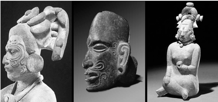
FIGURA 2.—Tatuajes y escarificaciones faciales. De izquierda a derecha. Personaje con orejeras, tocado y cara tatuada. Figurilla estilo Jaina, Clásico Tardío.—Hacha votiva de piedra, representación de cara humana con escarificación ornamental en mentón y sien. Clásico Tardío.—Personaje femenino sedente con tocado, orejeras y cara tatuada. Figurilla estilo Jaina, Clásico Tardío.