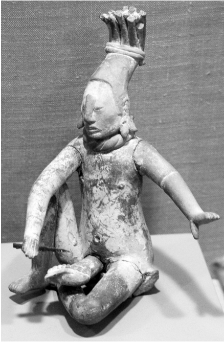
FIGURA 6.—Autosacrificio. Personaje sedente con navaja utilizada para sacar sangre del miembro masculino. Figurilla estilo Jaina, Clásico Tardío. Museo de Arte, Universidad de Princeton.